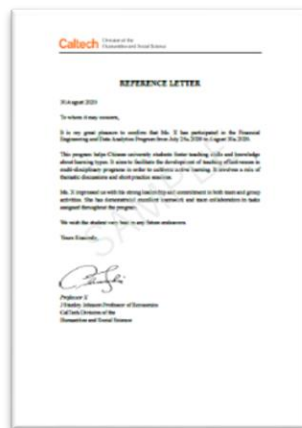
学员推荐证明信（示例）