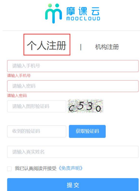
图 2 用户注册界面