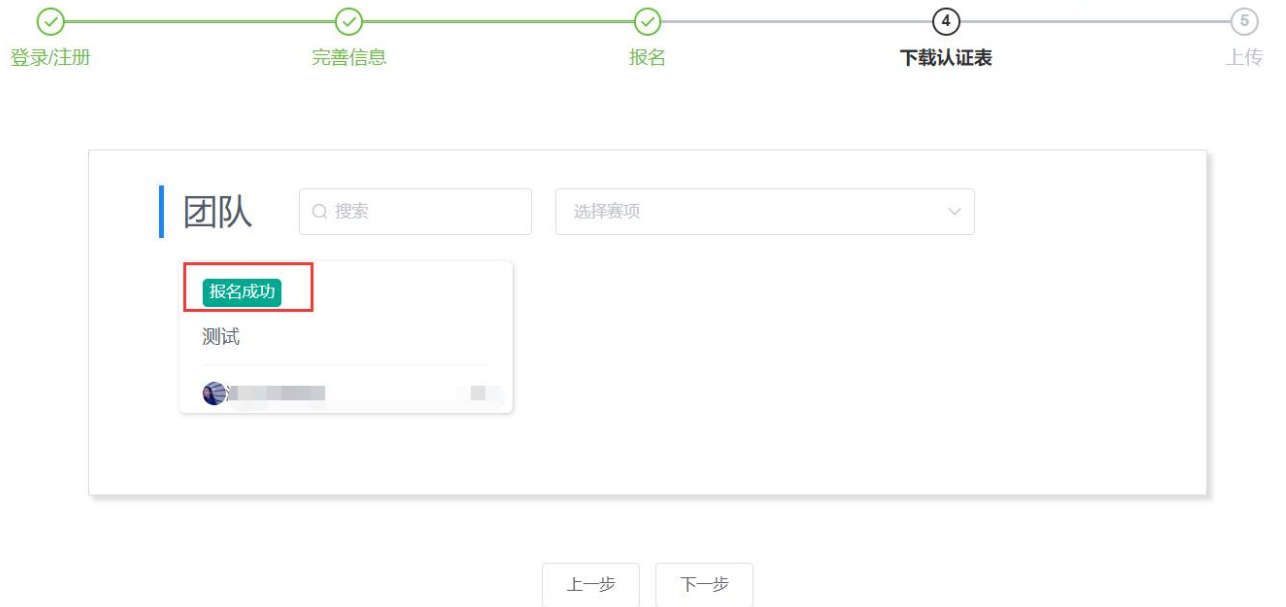
图 11 报名表审核成功页面