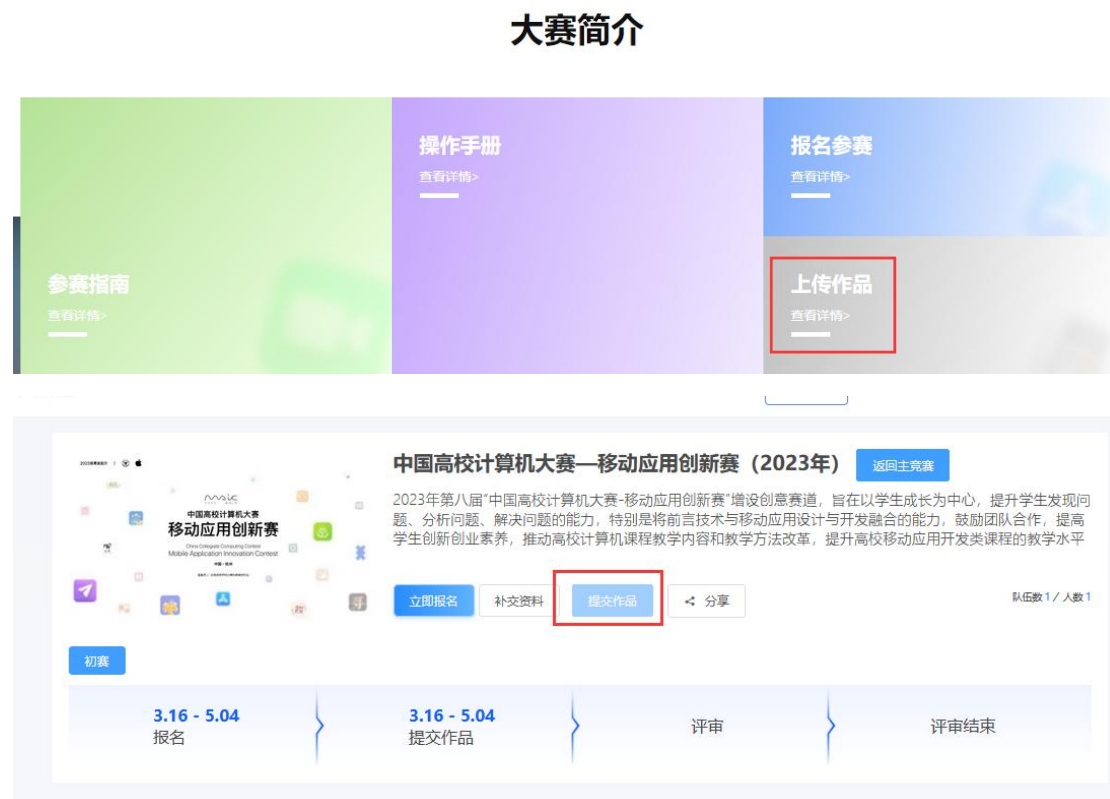
图 12 上传作品

当报名表审核通过侯，打开官网 http://www.appcontest.net/ ，点击上传作品，如图 12：