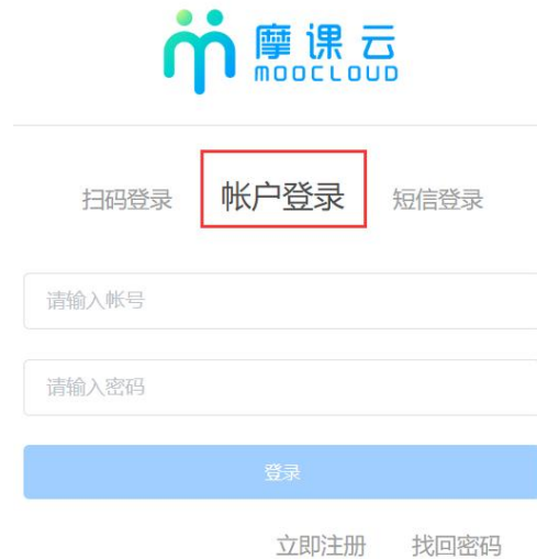
图 3 用户登录界面