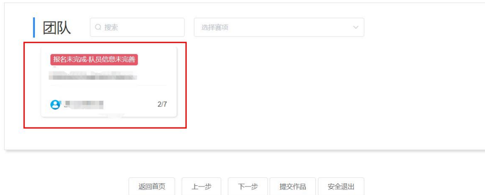
图 16 团队成员管理入口