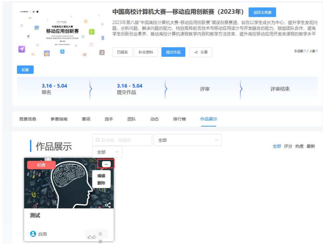
图 15 作品编辑