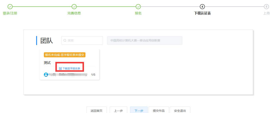
图 8 下载报名认证表入口

报名表需要由所有队员签名（可电子签名）后提交至网站。晋级至复赛阶段需要提交具有所在学校（或学院）教务部门盖章的报名表。