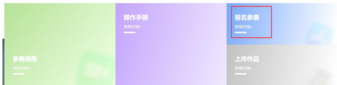
图 1 竞赛报名入口

(1) 注册登录；先注册（请用手机号注册），后登录；若已有账号，直接点击账户登录，图 2 显示了用户注册入口，图 3 显示了用户登录入口。