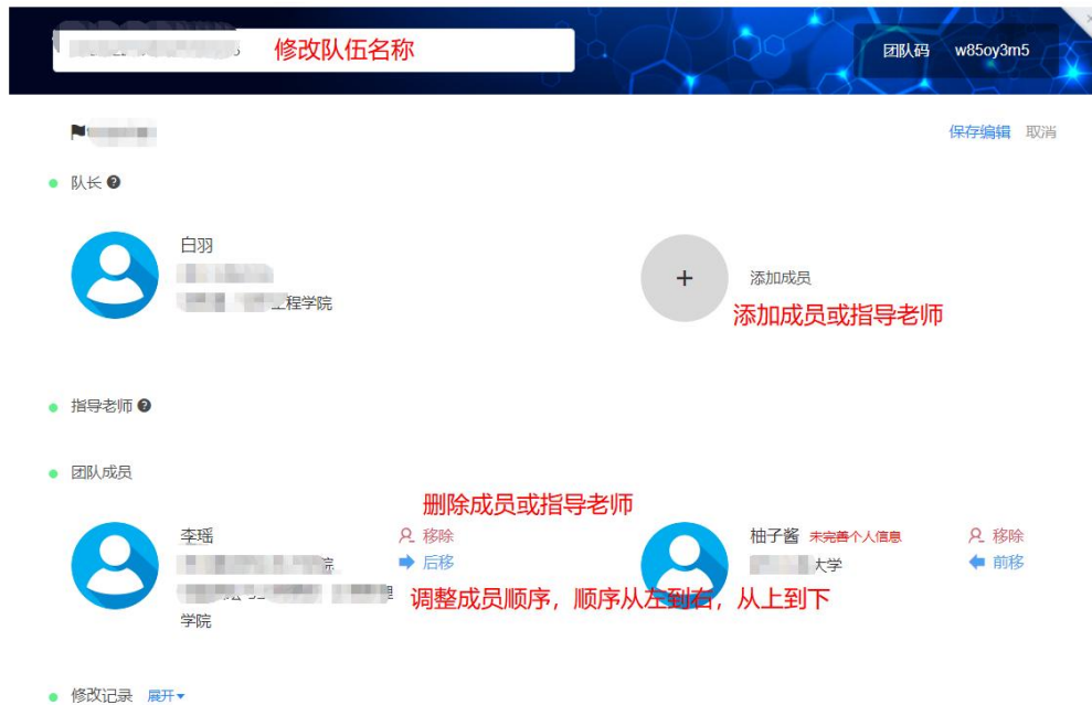
图 18 团队编辑操作页面