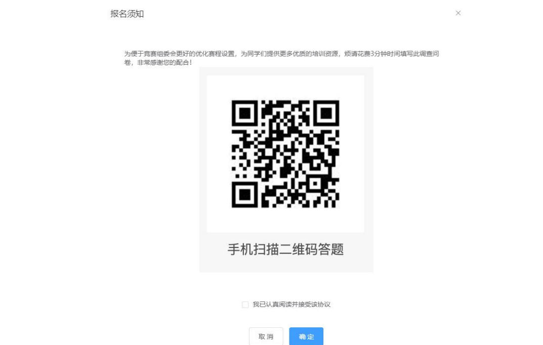
图 4 扫码填写