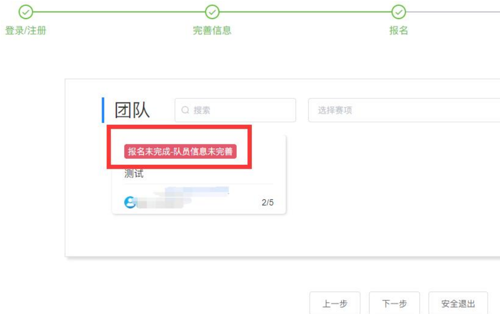
图 7 团队状态